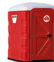
Contenuti di materiali e sostanze del bagno mobile Sebach TopSan® HN

Misure esterne del bagno Sebach TopSan® HN: cm 150x200x217 ca. (LxPxH) Capienza serbatoio reflui: 220 litri ca.